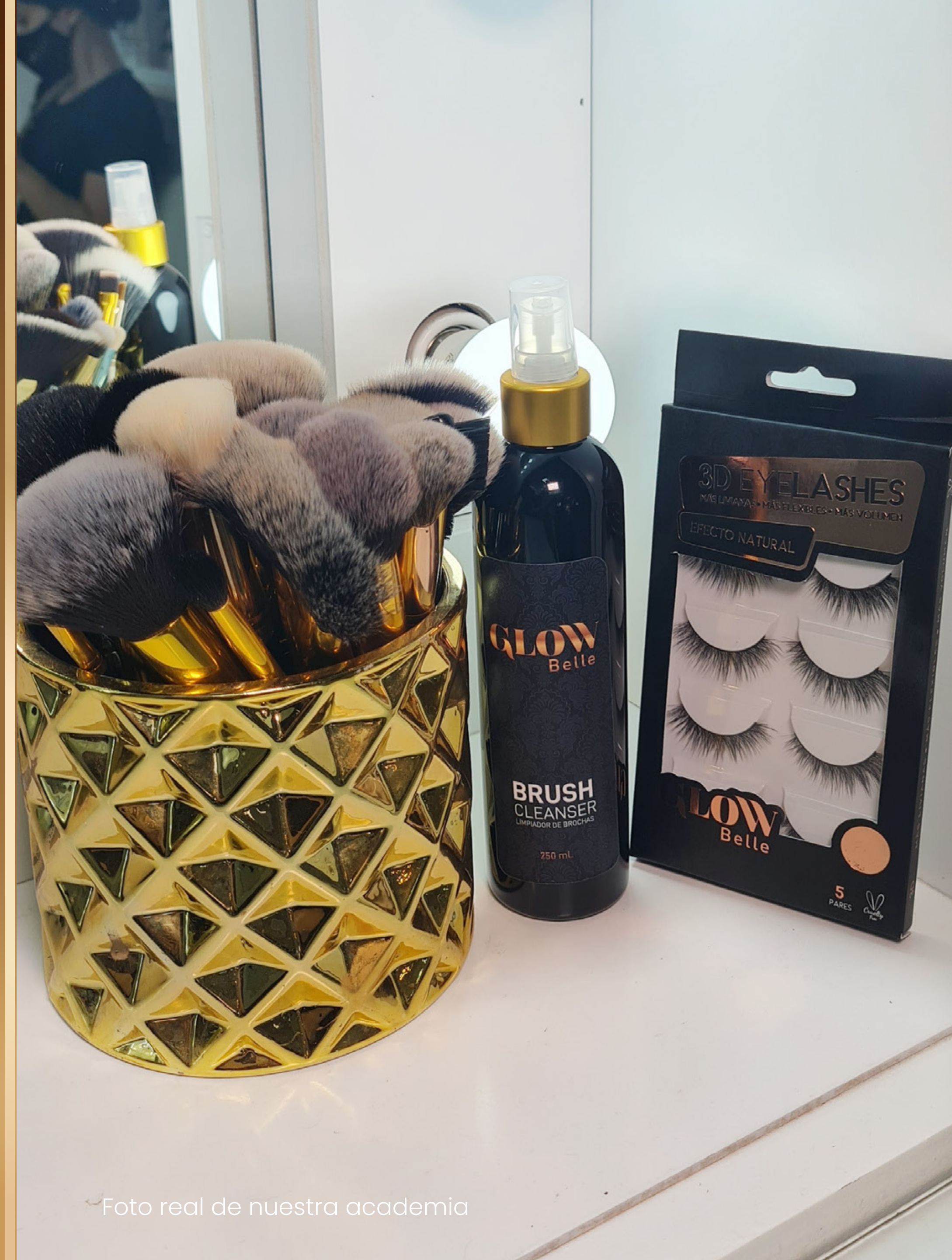
Foto real de nuestra academia