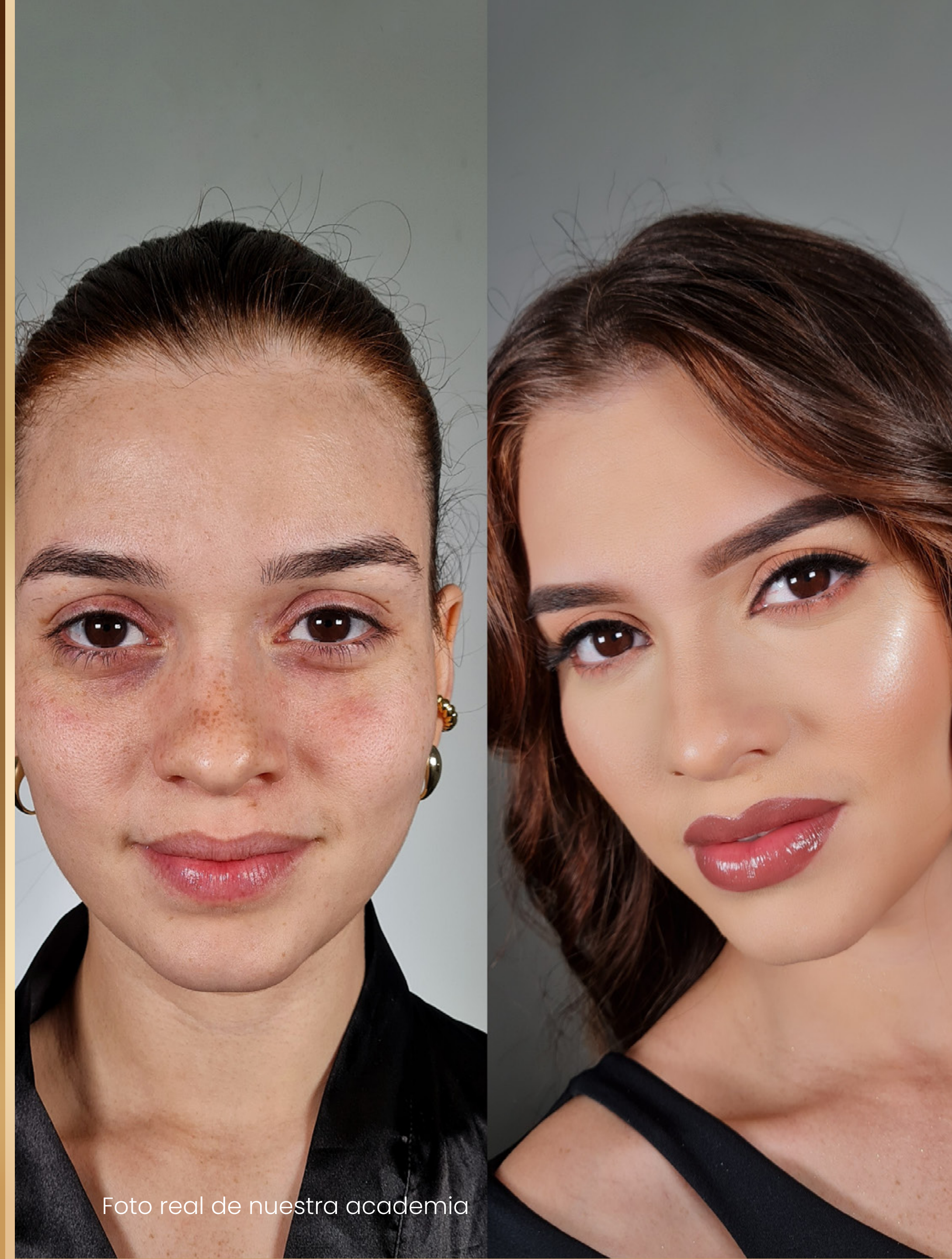
Foto real de nuestra academia