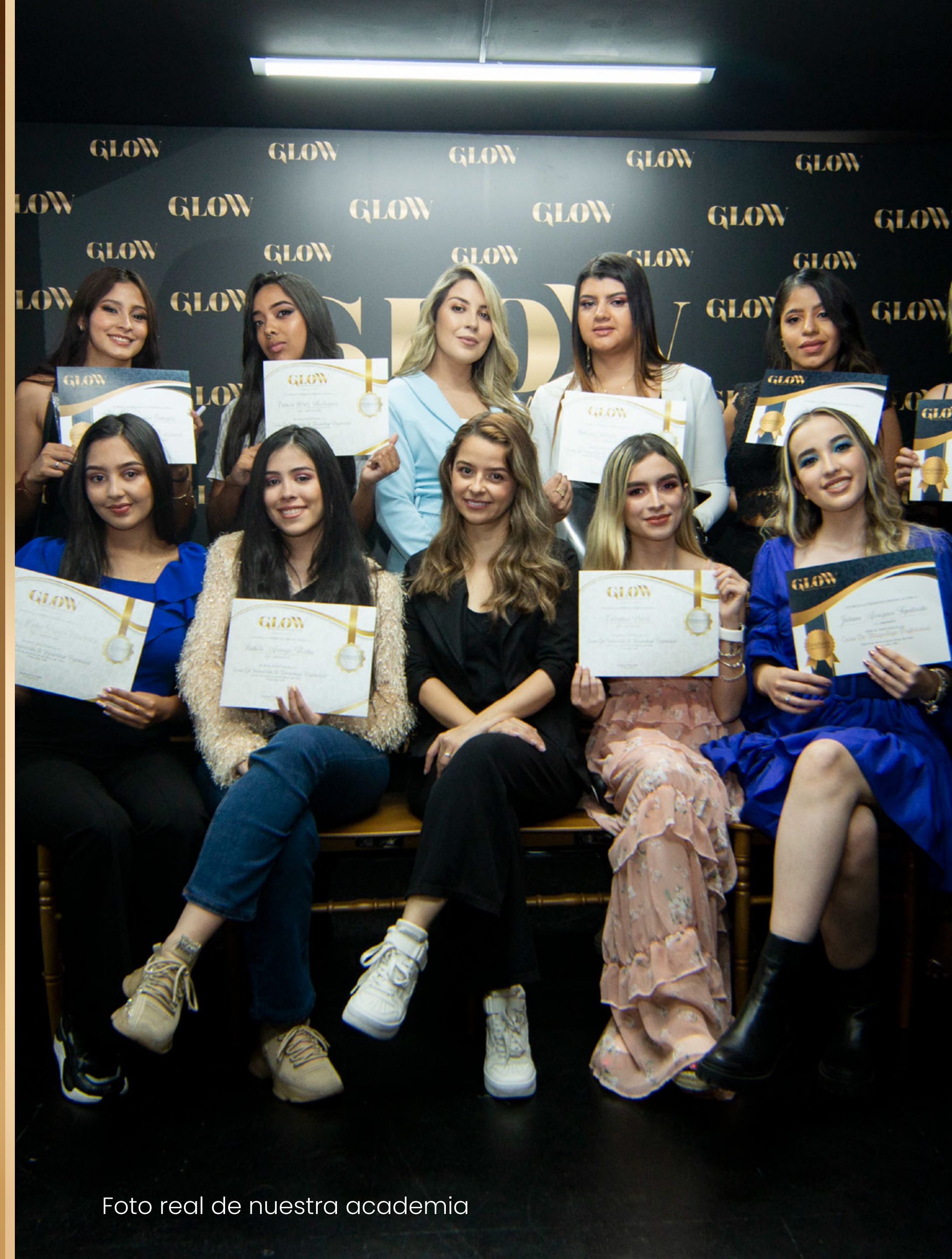
Foto real de nuestra academia