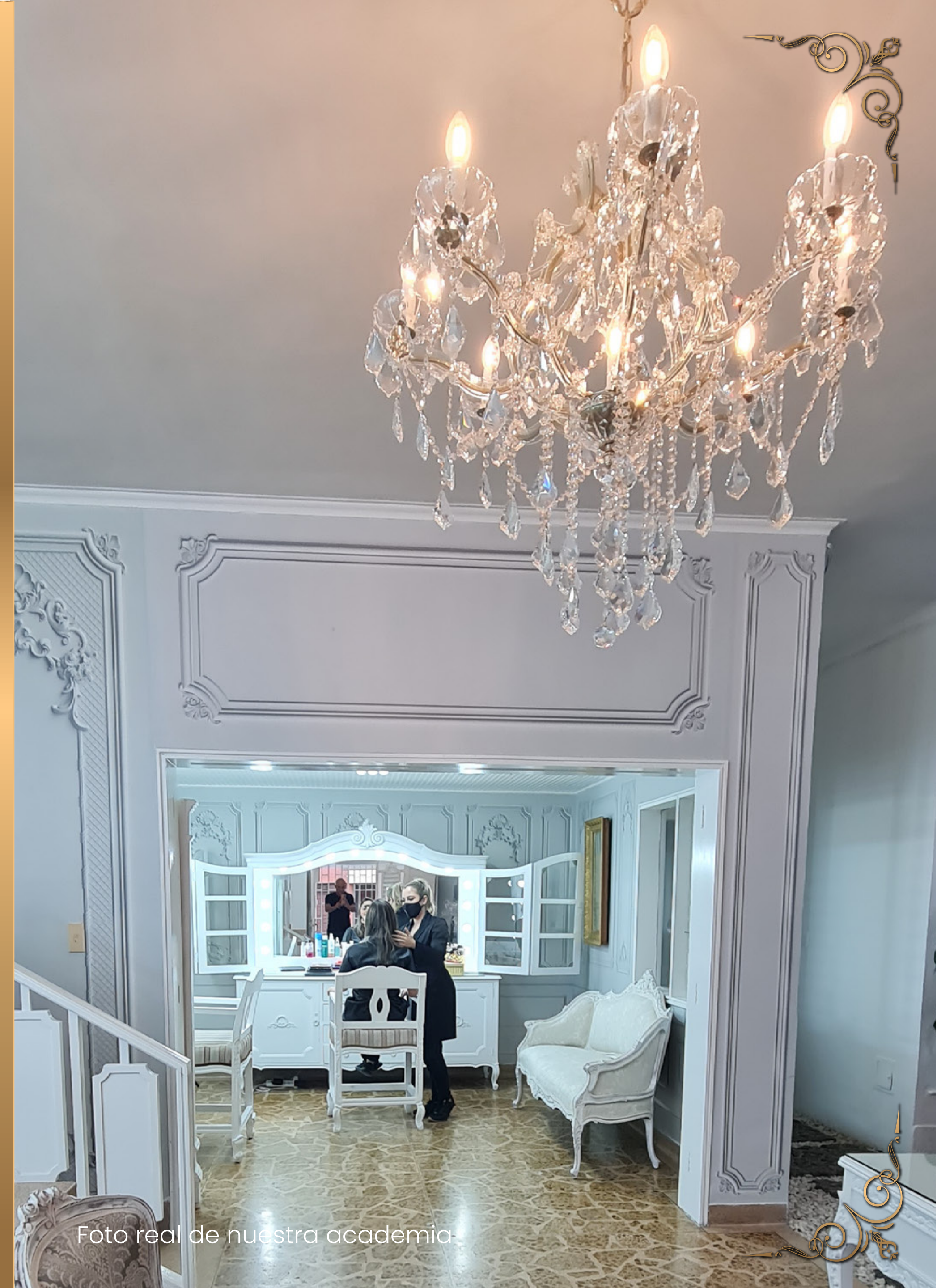
Foto real de nuestra academia