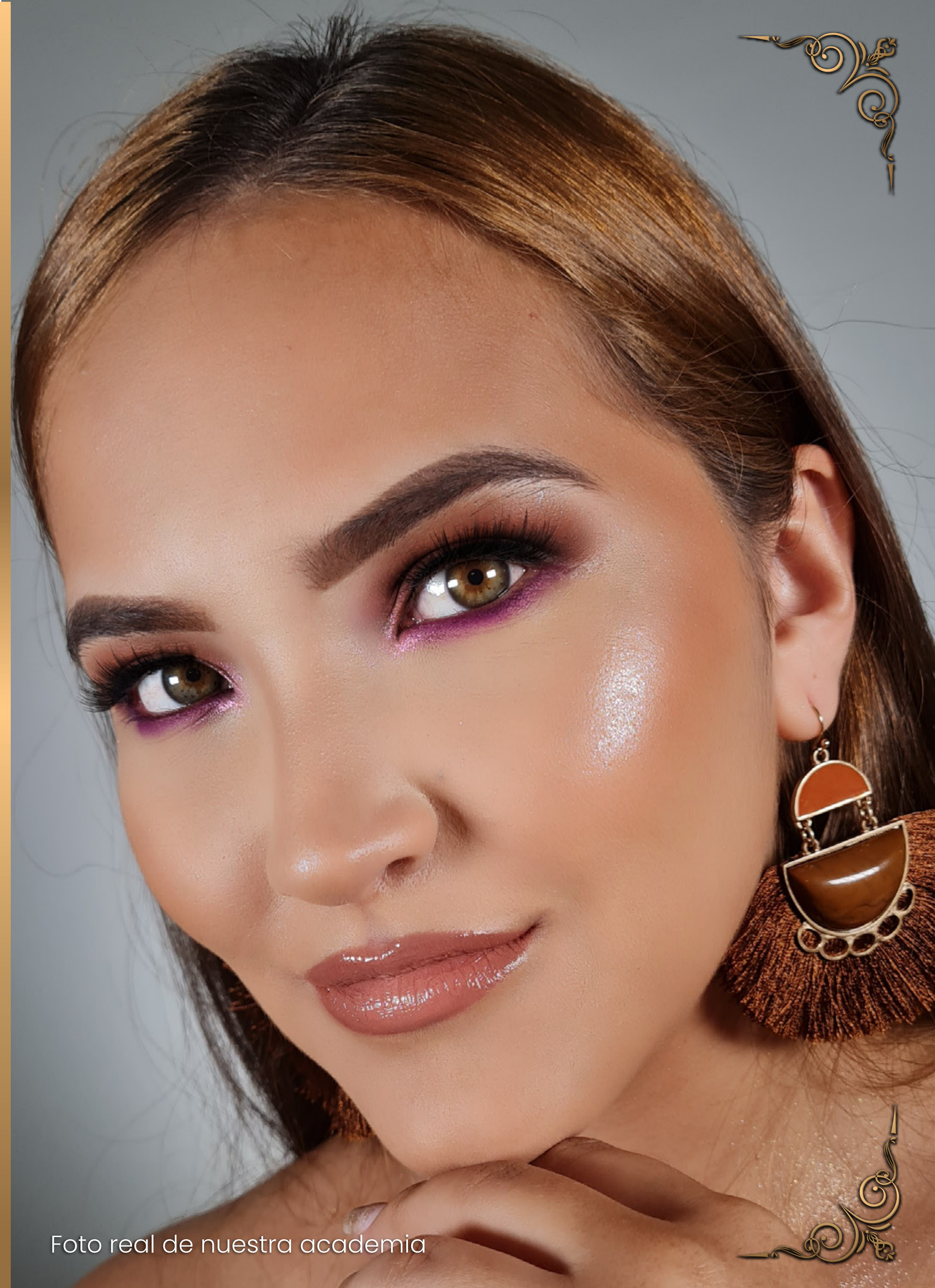
Foto real de nuestra academia