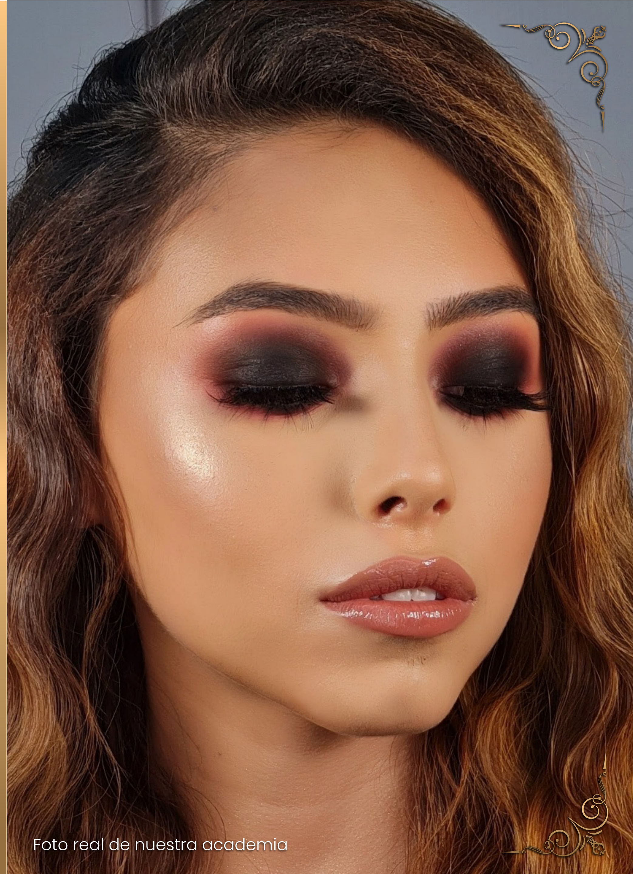
Foto real de nuestra academia