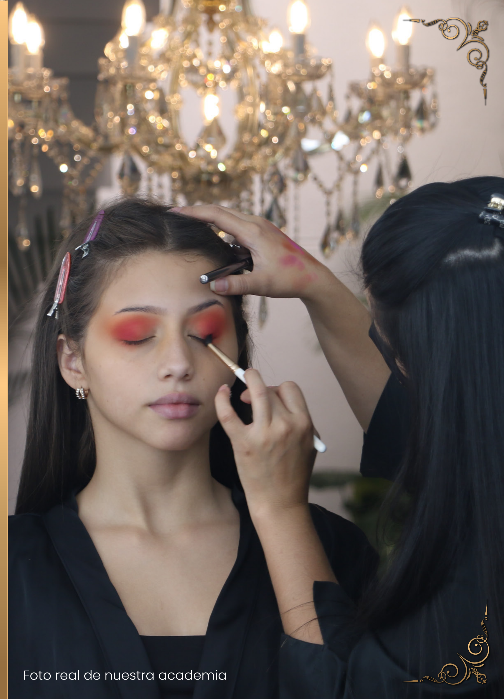
Foto real de nuestra academia