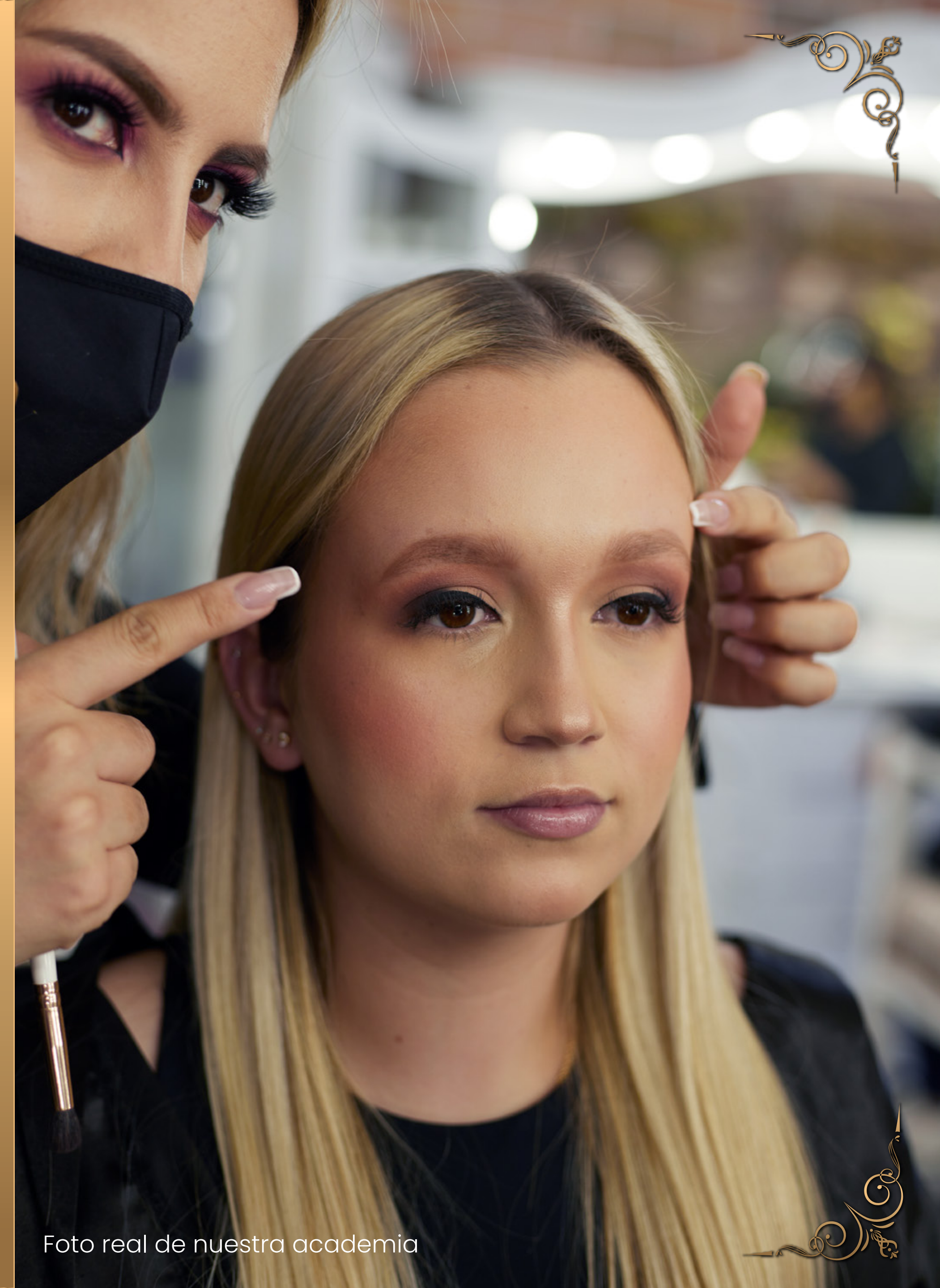
Foto real de nuestra academia