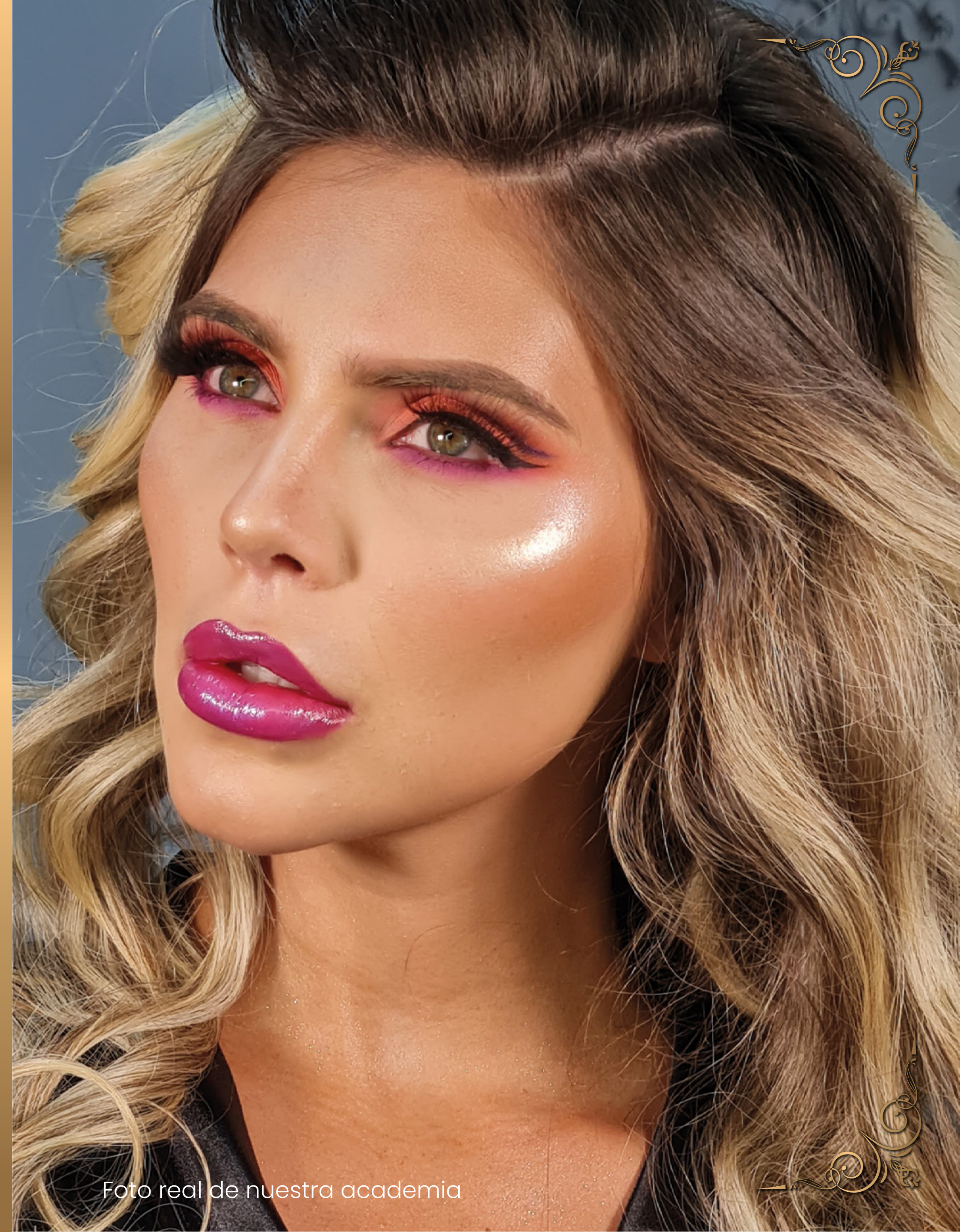
Foto real de nuestra academia