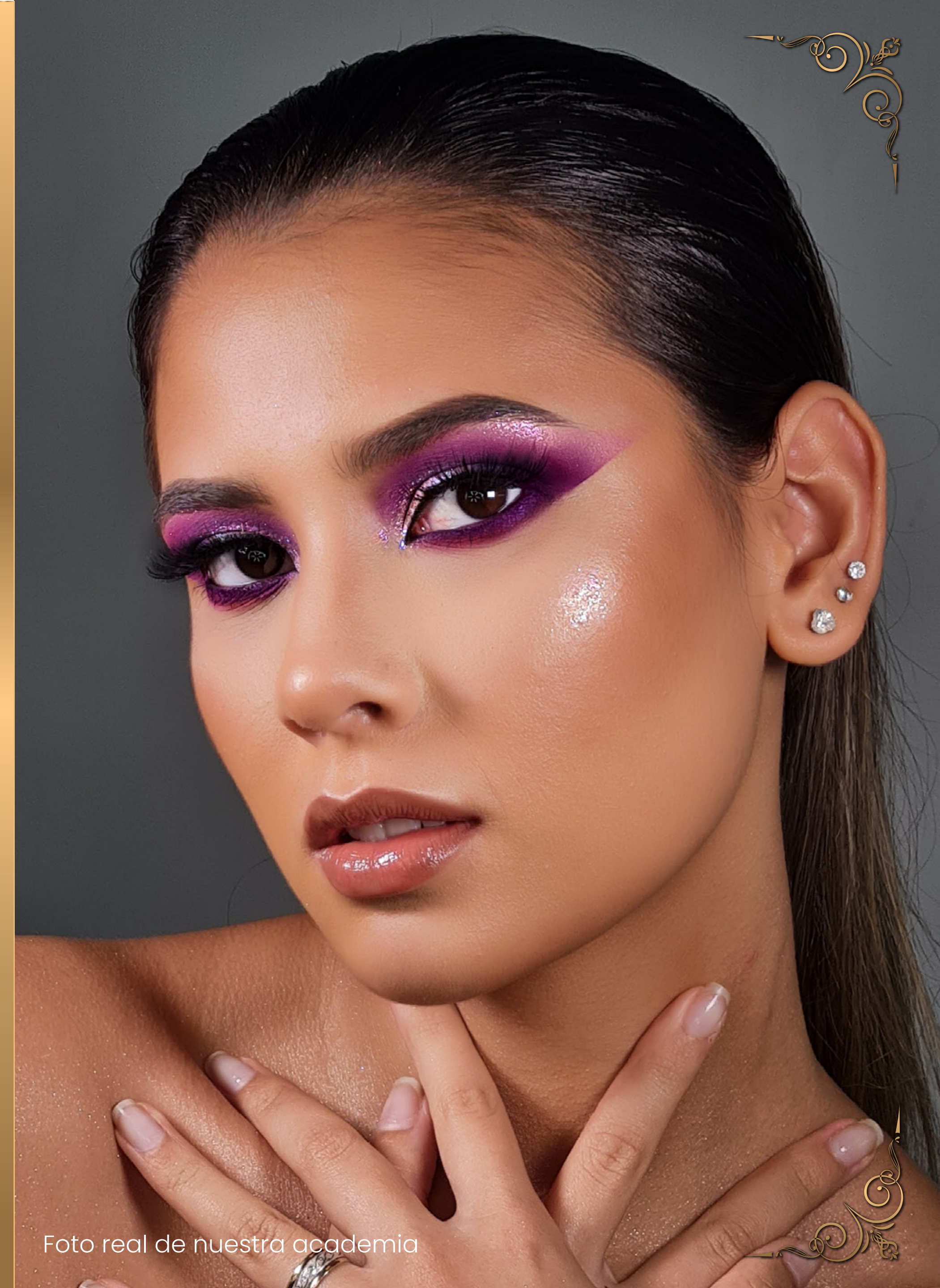
Foto real de nuestra academia