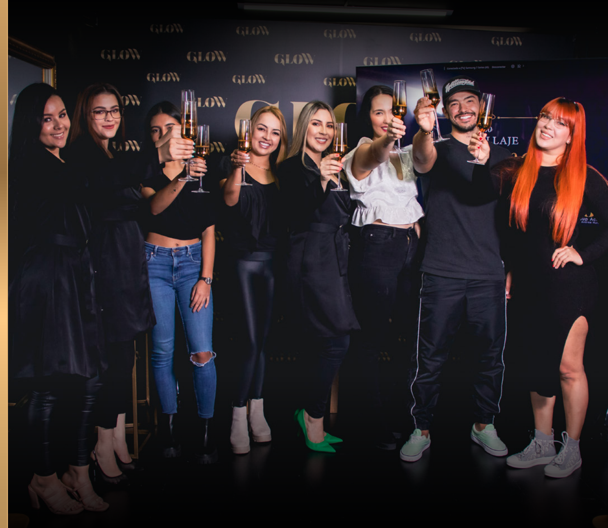
Foto real de nuestra academia