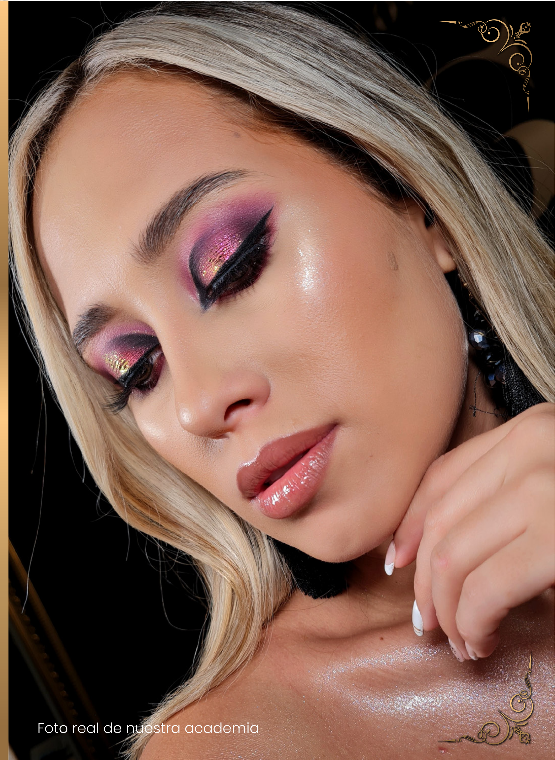
Foto real de nuestra academia