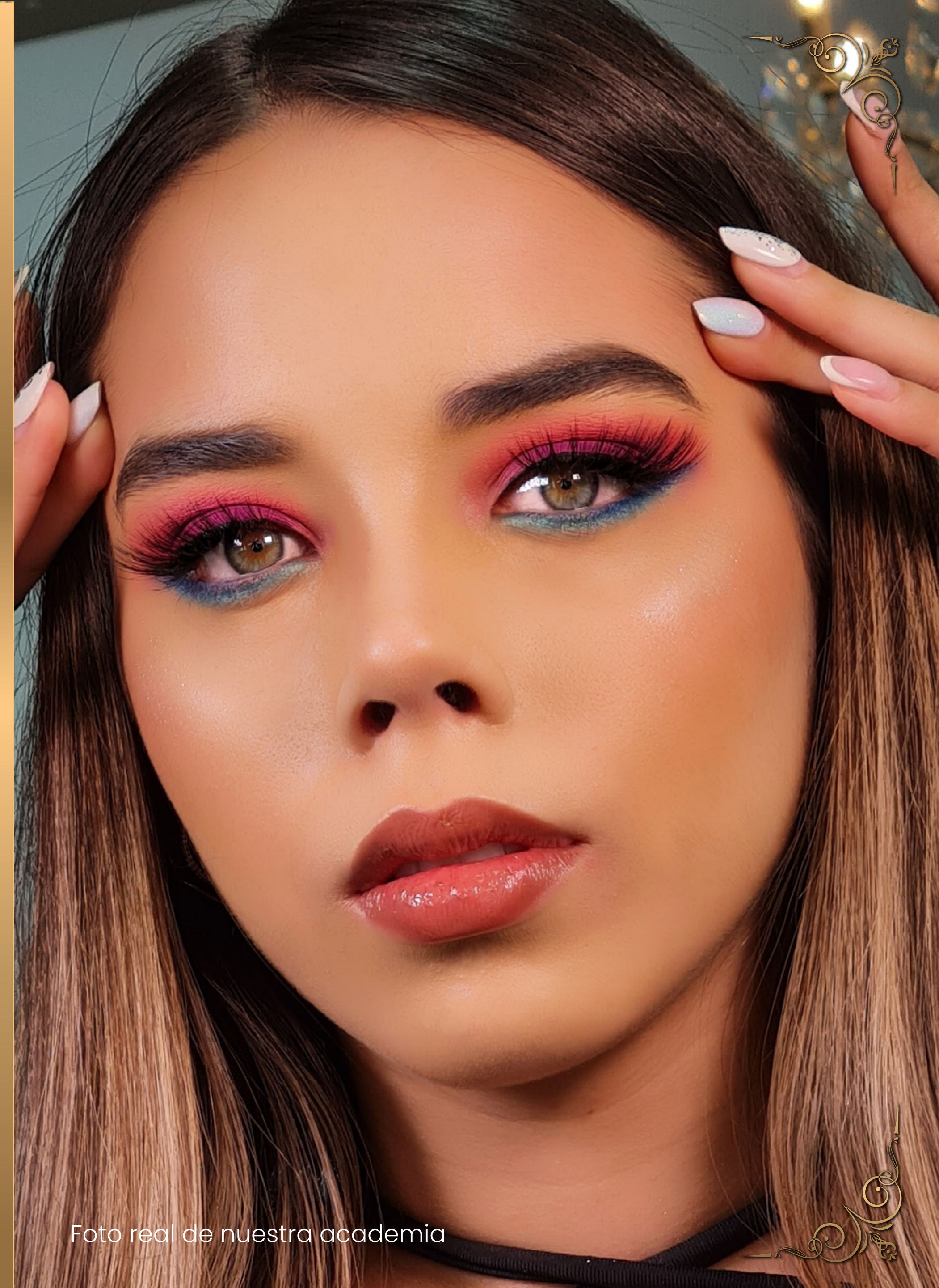
Foto real de nuestra academia