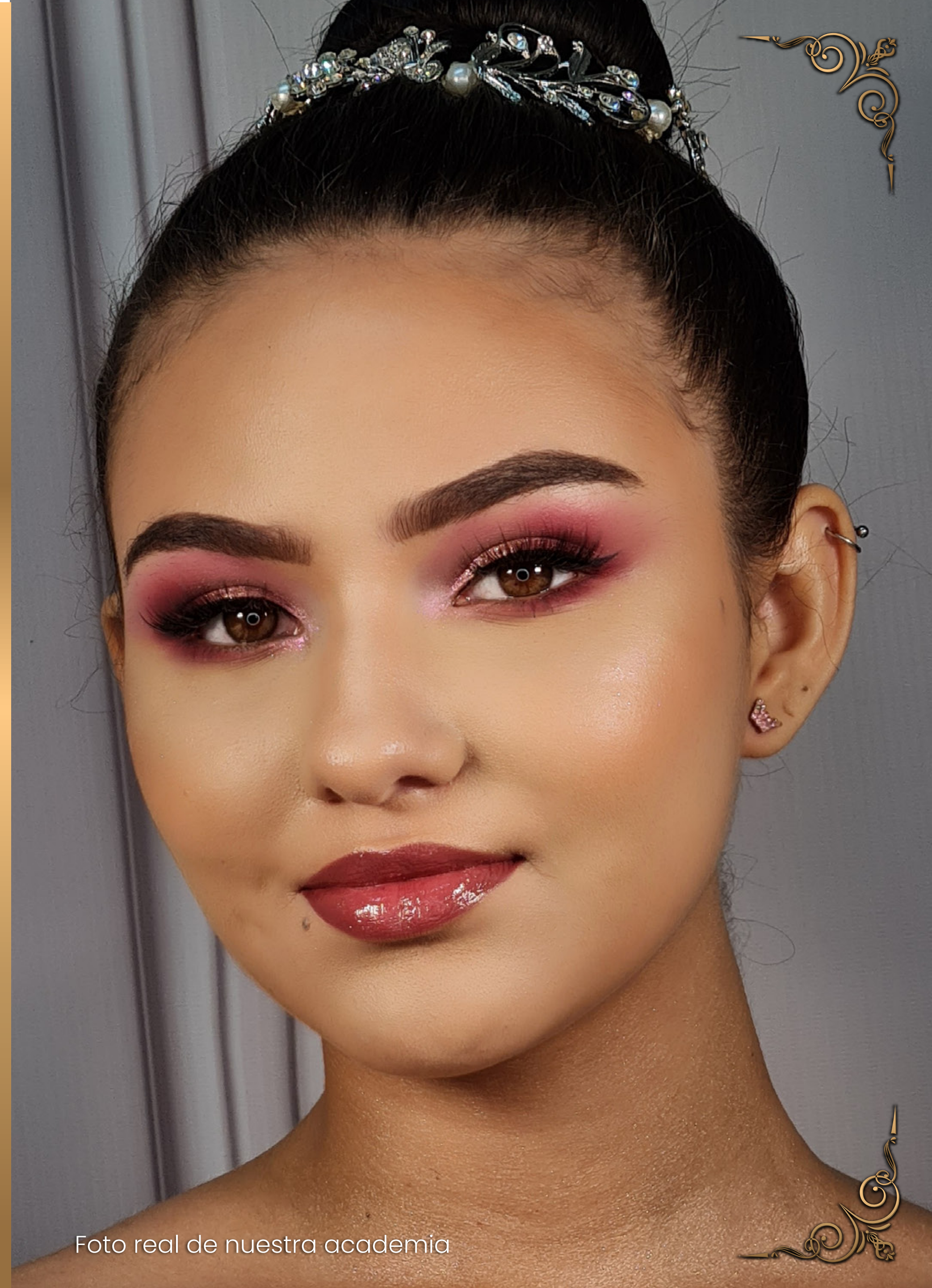
Foto real de nuestra academia